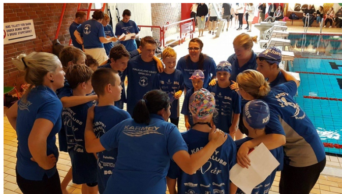
Rekruttstevne i Karmøyhallen.