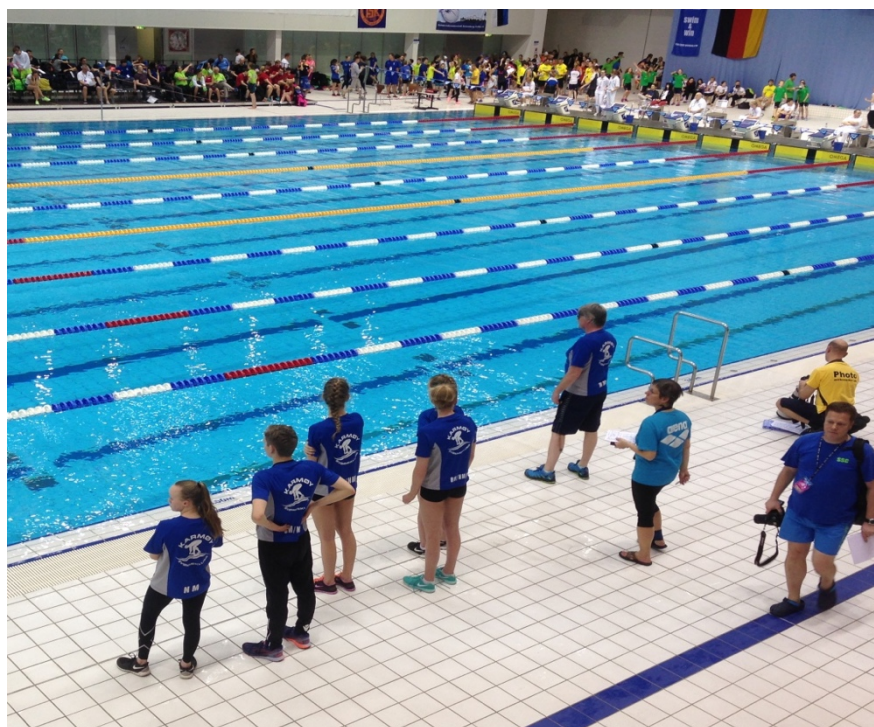
ISM Berlin 2016.