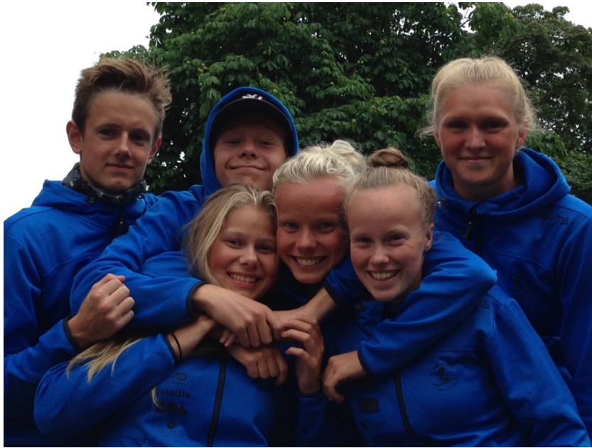
Glad gjeng på NUSS i Borås, Sverige.