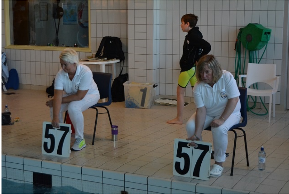
Karmøydommere i aksjon.